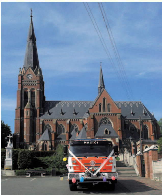
Nové požární vozidlo pro JSDH Sudice bylo slavnostně pokřtěno 28. dubna 2018.

EVROPSKÁ UNIE / UNIA EUROPEJSKA EVROPSKÝ FOND PRO REGIONÁLNÍ ROZVOJ EUROPEJSKI FUNDUSZ ROZWOJU REGIONALNEGO