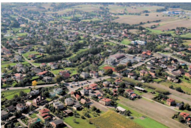
Gmina Świerklany z ptačí perspektivy.

Zpracováno na základě: www.obecslatina.cz