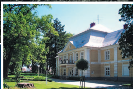
Představujeme nové členy Euroregionu Silesia