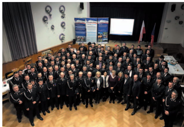
Dne 16. února 2018 se v Chuchelně konalo úvodní setkání zástupců všech českých a polských jednotek dobrovolných hasičů zapojených do projektu.

V rámci projektu, který bude realizován až do konce roku 2019, budou pořízena 4 nová požární vozidla (2 pro české jednotky a 2 pro polské) a další technické vybavení pro 19 jednotek. Na samotné posílení přeshraniční připravenosti a akceschopnosti dobrovolných požárních jednotek jsou zaměřeny aktivity zahrnující 4 společná taktická cvičení realizovaná střídavě na české a polské straně, 2 turnusy společných soustředění v Ústřední hasičské škole s programem teoretických školení a praktického výcviku pod názvem „Univerzita dobrovolného hasiče“ a společná pracovní setkání všech zapojených jednotek. Nedílnou součástí projektu je také analýza systému společné ochrany hraničních obcí v Euroregionu Silesia a zpracování stručného a srozumitelného manuálu společné ochrany jako pomůcky pro jednotky dobrovolných hasičů při provádění zásahu na druhé straně hranice.