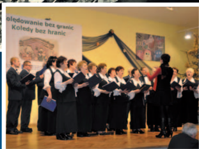
Euroregion Silesia žije hudbou