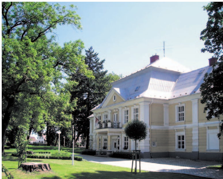
Barokní zámek z roku 1771 v centru obce Slatina dnes slouží jako obecní úřad, knihovna a reprezentativní prostory obce se svatební síní.