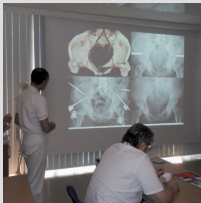
V rámci projektu „Česko-polská spolupráce v medicíně katastrof“ se v lednu 2017 v edukačním centru Fakultní nemocnice v Ostravě konal jeden ze společných workshopů českých a polských lékařů, který byl zaměřen na fixování pánve po úrazech.

Prioritní osa programu INTERREG V-A ČR– Polsko: 4